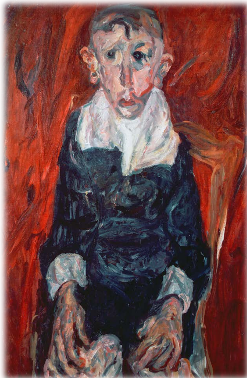
Soutine, L'Idiot du village , 1919

- Enfin, plus concrètement, en guise de réflexion préparatoire, la méthodologie envisageable dans la perspective d'une histoire interdisciplinaire de l'intelligence et de ses représentations littéraires, scientifiques, médiatiques et artistiques (problèmes terminologiques ; structure ; modes de collaboration...)