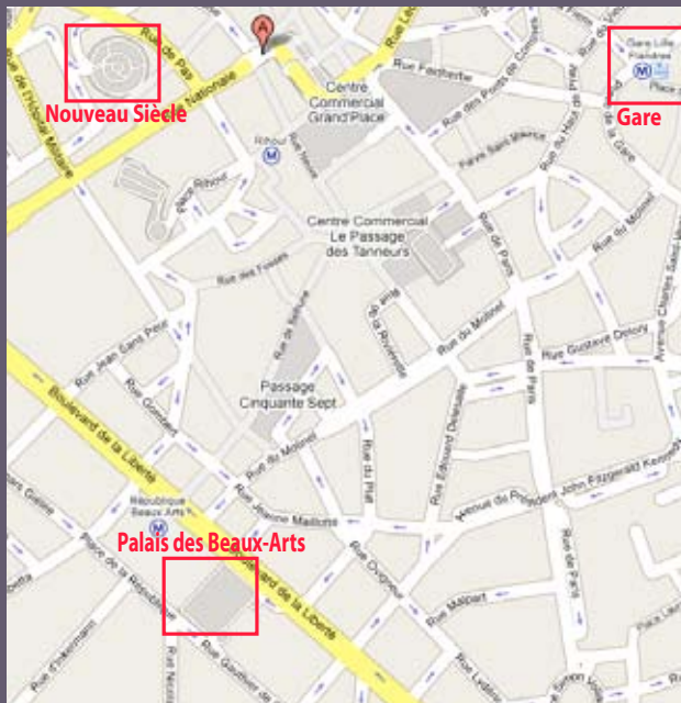
Plan du centre ville de Lille